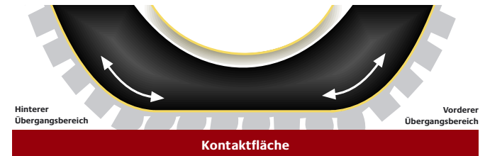
Abb.: Energieverlust aufgrund der Verformung in der Kontaktfläche

Diese wesentliche Änderung in der Gummimischung führt zu einer spürbaren Verbesserung des Rollwiderstands um bis zu 30 Prozent im Vergleich zu herkömmlichen Reifen.