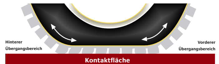
Abb.: Energieverlust aufgrund der Verformung in der Kontaktfläche

Um die Verformung des Reifens zu reduzieren, muss die Steifigkeit des Gummimisches erhöht werden. Da aber auch andere wichtige Reifeneigenschaften wie Abriebfestigkeit und Straßenhaftung zu berücksichtigen sind, kommt als Verstärkerfüllstoff eine innovative Silica/Silan-Mischung statt der herkömmlichen Rußpartikel zum Einsatz. Diese veränderte Gummimischung führt zu einer Reduzierung des Rollwiderstands um bis zu 30 Prozent.