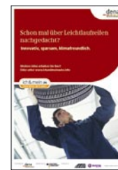
Plakat DIN A2 für Händler und Werkstätten