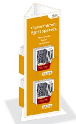
Display für 4 x 15 Broschüren ca. 15 x 48 x 16 cm