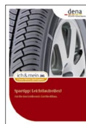
Informationsbroschüre DIN A6

Sie wollen dabei sein und die Materialien bestellen? Einfach unter www.ichundmeinauto.info anfordern – und die Materialien gehen Ihnen in wenigen Tagen zu.