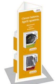
Display für 4 x 15 Broschüren ca. 15 x 48 x 16 cm