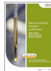
Plakat DIN A2