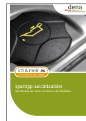
Informationsbroschüre DIN A6

Dafür initiiert, koordiniert und realisiert die dena innovative Projekte und Kampagnen auf nationaler und internationaler Ebene. Sie informiert Endverbraucher, kooperiert mit allen gesellschaftlichen Kräften in Politik und Wirtschaft und entwickelt Strategien für die zukünftige Energieversorgung. Ihre Gesellschafter sind die Bundesrepublik Deutschland, die KfW Bankengruppe, die Allianz SE, die Deutsche Bank AG sowie die DZ BANK AG.