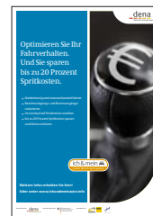
Plakat DIN A2