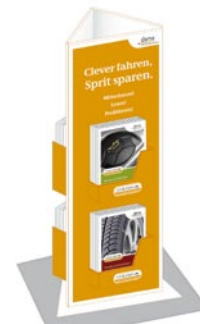
Display für 4 x 15 Broschüren ca. 15 x 48 x 16 cm