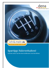
Informationsbroschüre DIN A6

Sie wollen dabei sein und die Materialien zum Selbstkostenpreis bestellen? Einfach unter www.ichundmeinauto.info anfordern – und die Materialien gehen Ihnen in wenigen Tagen zu.